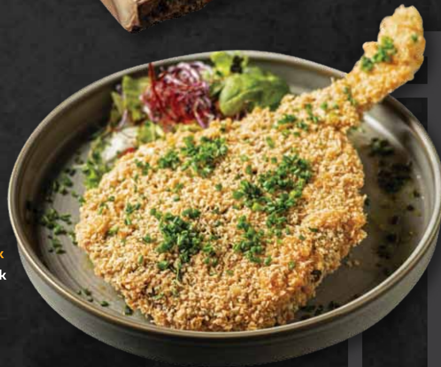
Rántott tomahawk Breaded tomahawk 3.480 Ft