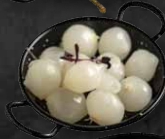
Gyöngyhagyma Pickled pearl onion 1.480 Ft