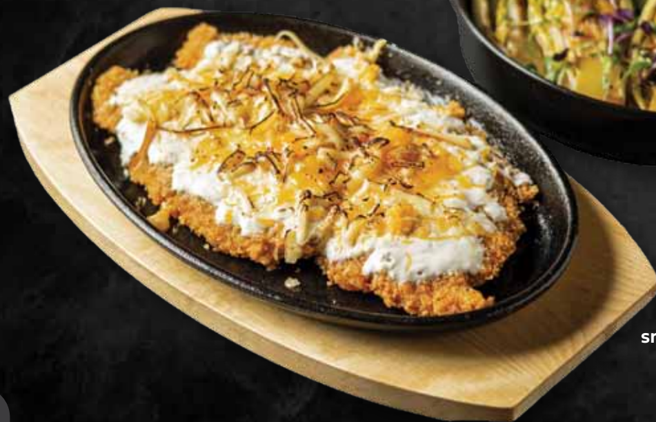
Ránott sertésszűz füstölt sajttal besütve, mézes mutáros grill salátával Deep fried schnitzel with smoked cheese oven baked and honey-mustard grilled salad 6.480 Ft