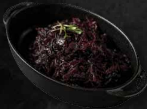
Párolt lilakáposzta Stewed cabbage