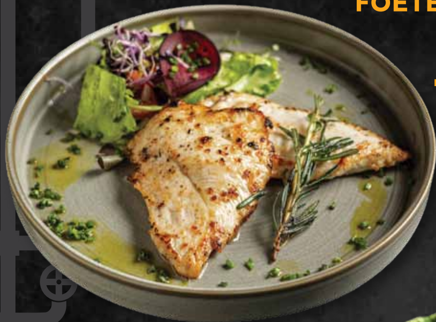
Vajas rozsmaringos jérce Butter-rosemary chicken 3.680 Ft