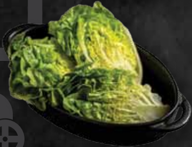
Ecetes szívsaláta Pickled salad 1.680 Ft