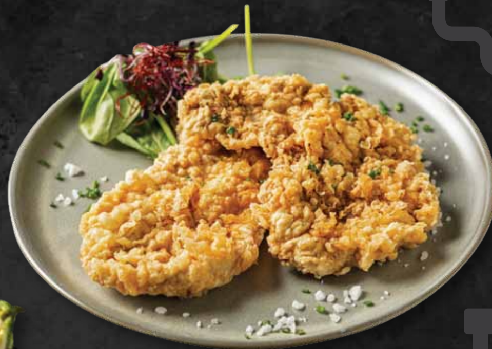
Párizsi bundás szűzérme Parisian style pork fillet 4.480 Ft