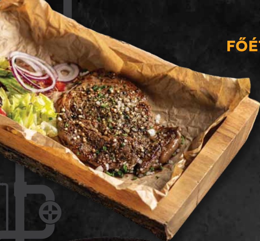
Angus Rib-Eye steak 250g / 9.980 Ft