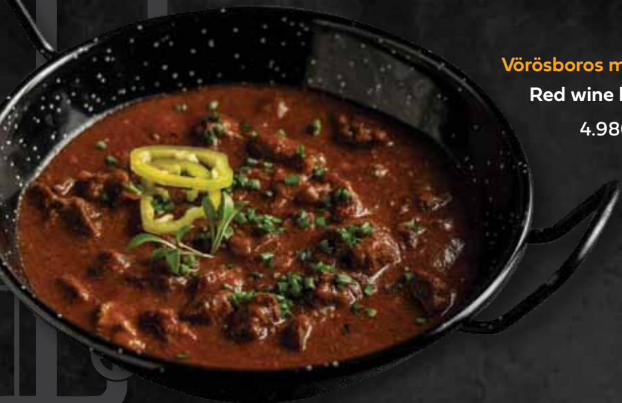
Vörösboros marhapörkölt Red wine beef stew 4.980 Ft