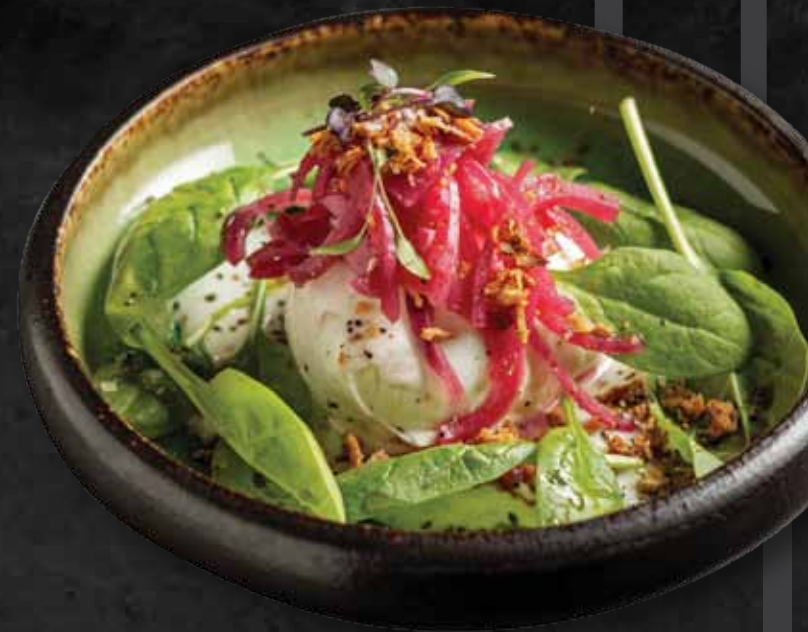
Citrusos burrata saláta