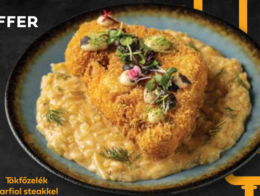
Tökfőzelék karfiol steakkal