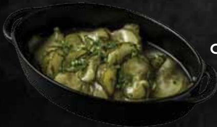
Uborkasaláta Cucumber salad 1.280 Ft