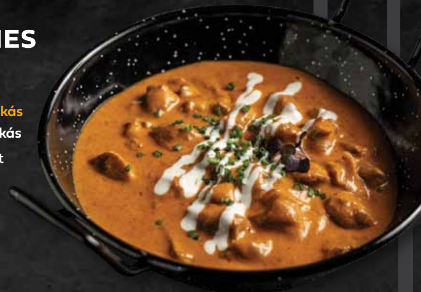
Borjúpaprikás Veal paprikás 5.480 Ft