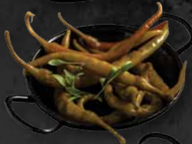
Pepperoni Pepperoni 1.480 Ft