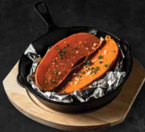
Sült édesburgonya Baked sweetpotato