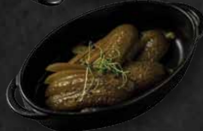
Csemege uborka Pickles 1.280 Ft