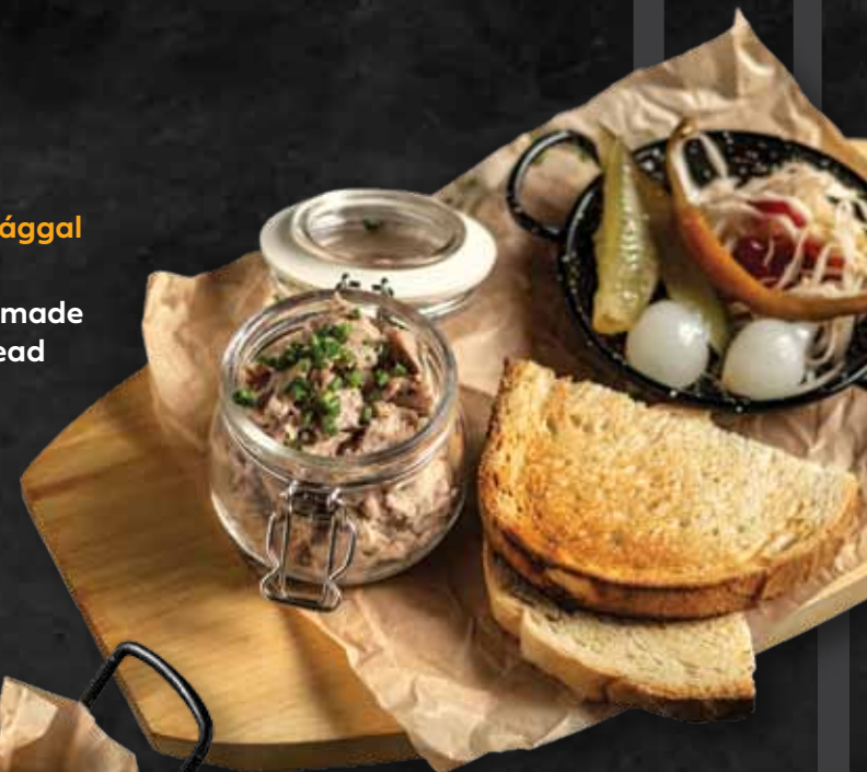
Kacsa rillette savanyúsággal és házi kenyérrel Duck rillette with homemade pickles and rustic bread 3.480 Ft