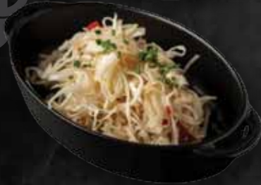
Káposzta saláta Sauerkraut 1.280 Ft