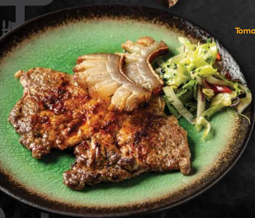
Tomahawk cigánypecsenye Tomahawk 'cigánypecsenye' 3.680 Ft