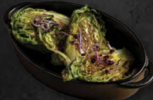
Mézes mustáros grillezett szívsaláta Honey-mustard grilled salad