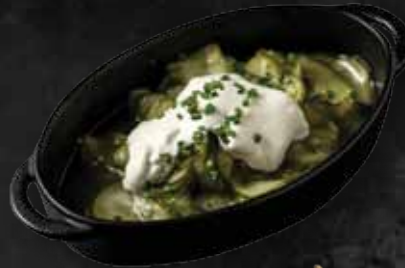
Tejfölös uborkasaláta Cucumber salad with sour cream 1.280 Ft