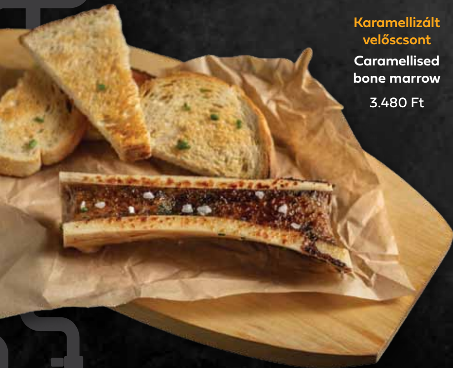
Karamellizált velőscsont Caramellised bone marrow 3.480 Ft