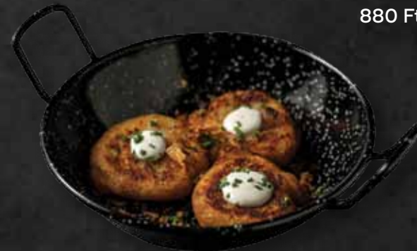
Sajtos dödölle Cheesy dödölle