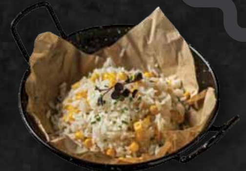
Kukoricás rizs Rice with corn