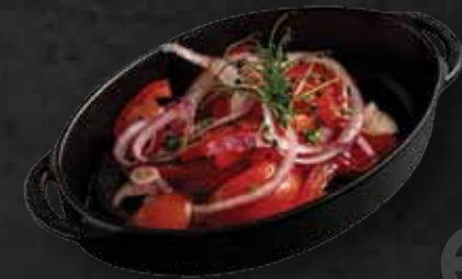
Paradicsom saláta Tomato salad 1.280 Ft