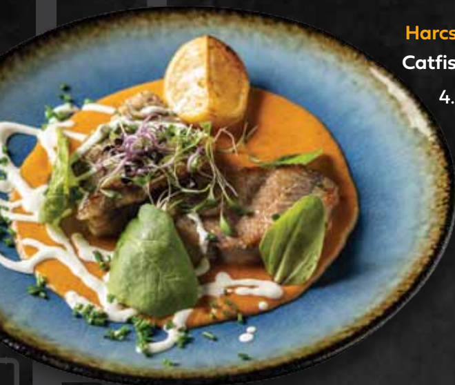
Harcsapaprikás Catfish paprikás 4.980 Ft