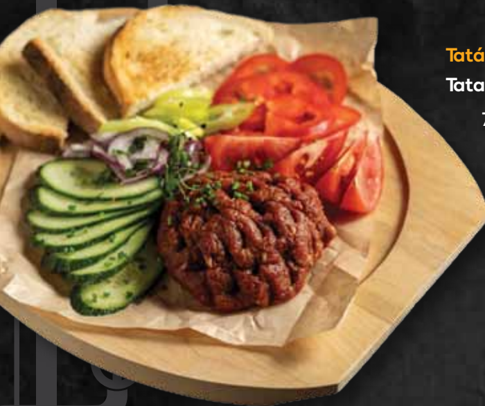
Tatár beefsteak Tatar beefsteak 7.480 Ft