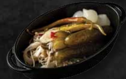
Vegyes savanyú /gyöngy hagyma, pepperoni, csemege uborka, káposzta/