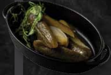
Kovászos uborka Summer dill cucumber 1.280 Ft