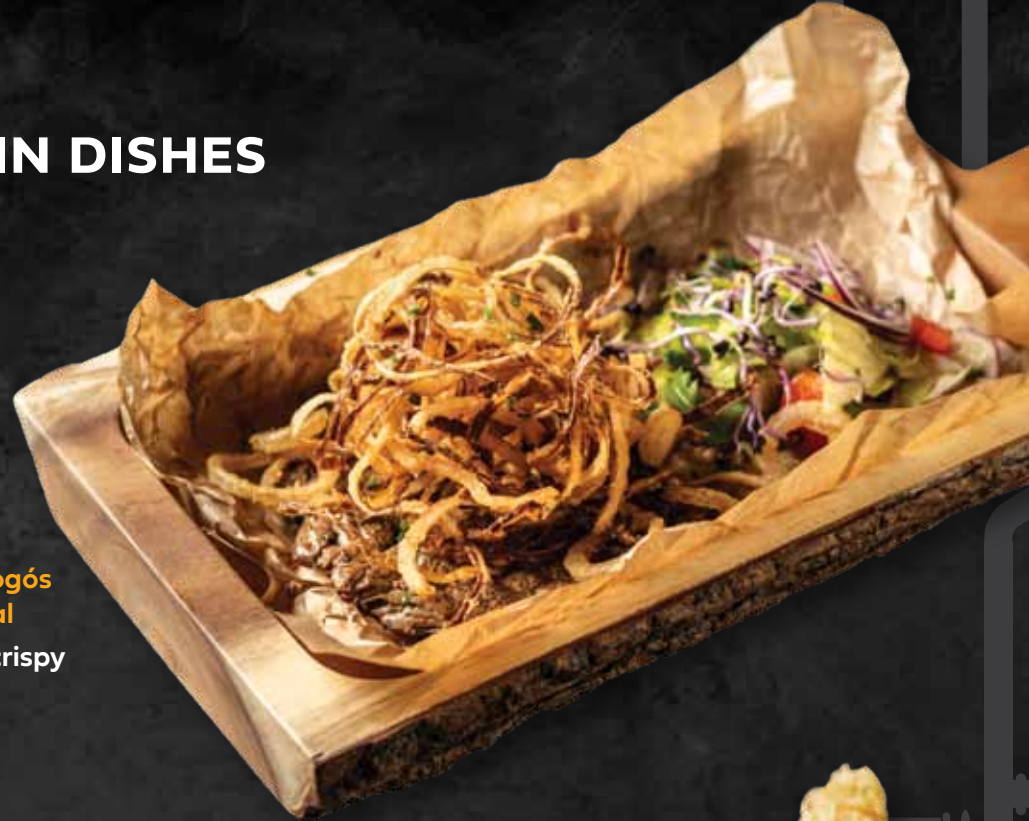
Bélszínlángos ropogós lyoni hagymával Steak lángos with crispy lyoni onion 10.980 Ft