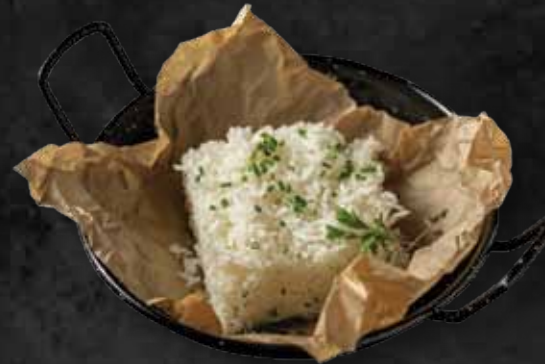
Jázmin rizs Jasmine rice