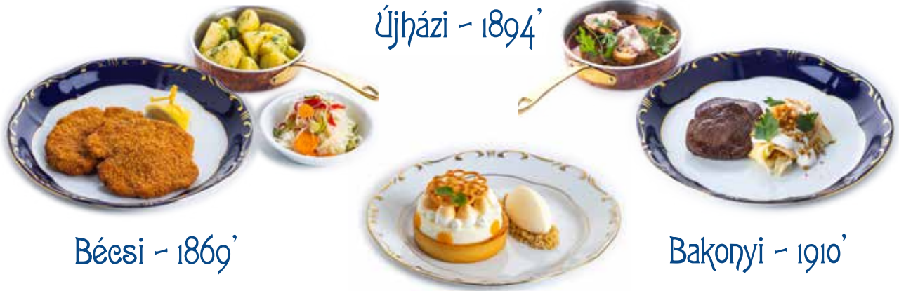
Bécsi - 1869'