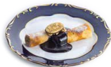
Gundel - 1942'