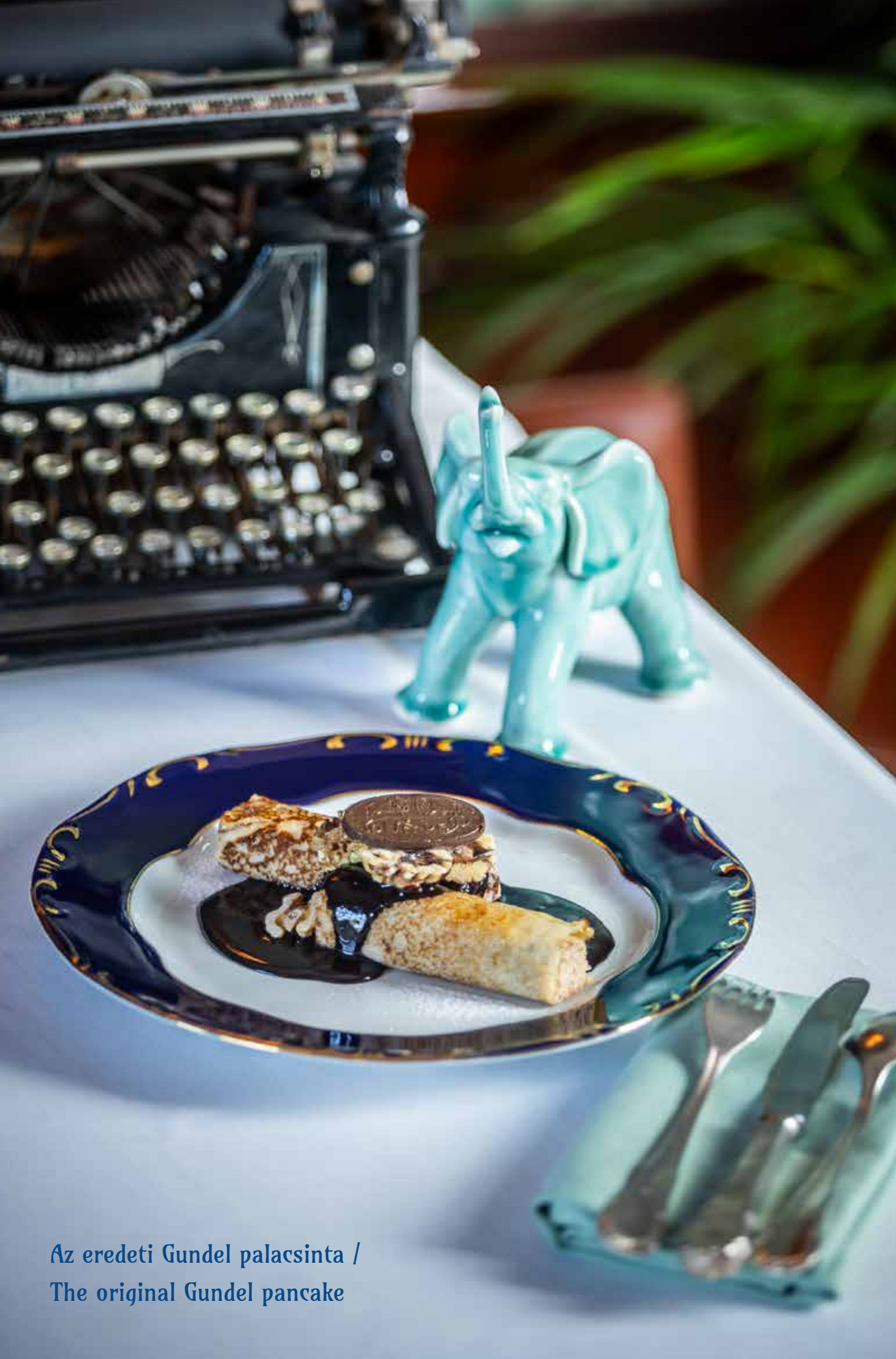
Az eredeti Gundel palacsinta / The original Gundel pancake