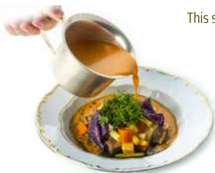
Palóe - 1892'

This symbol indicates the special choices of the Gundel National 11.