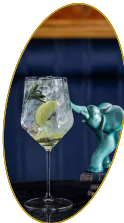
Monkey 47 Gin&Tonic