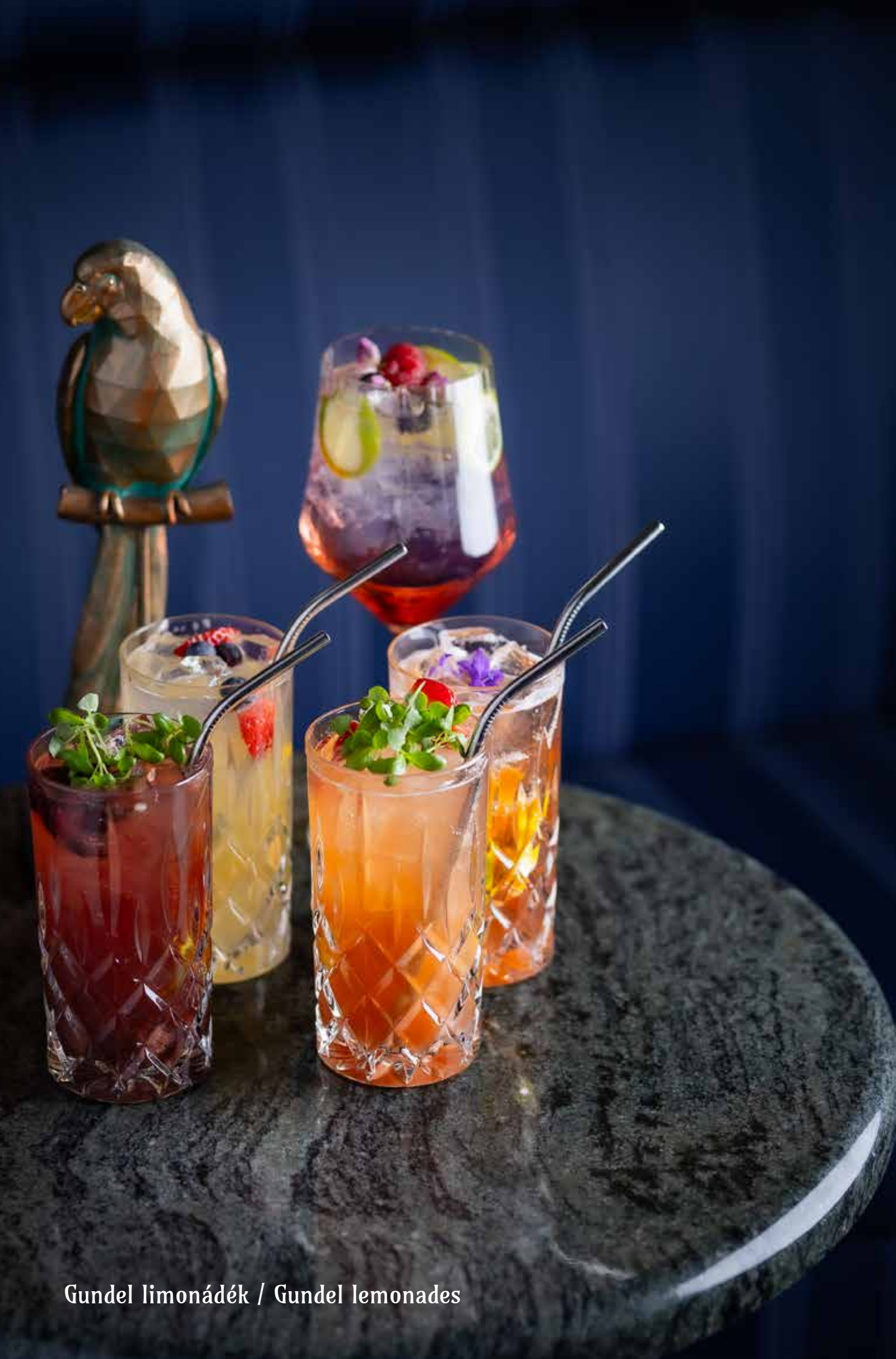
Gündel limonádék / Gündel lemonades