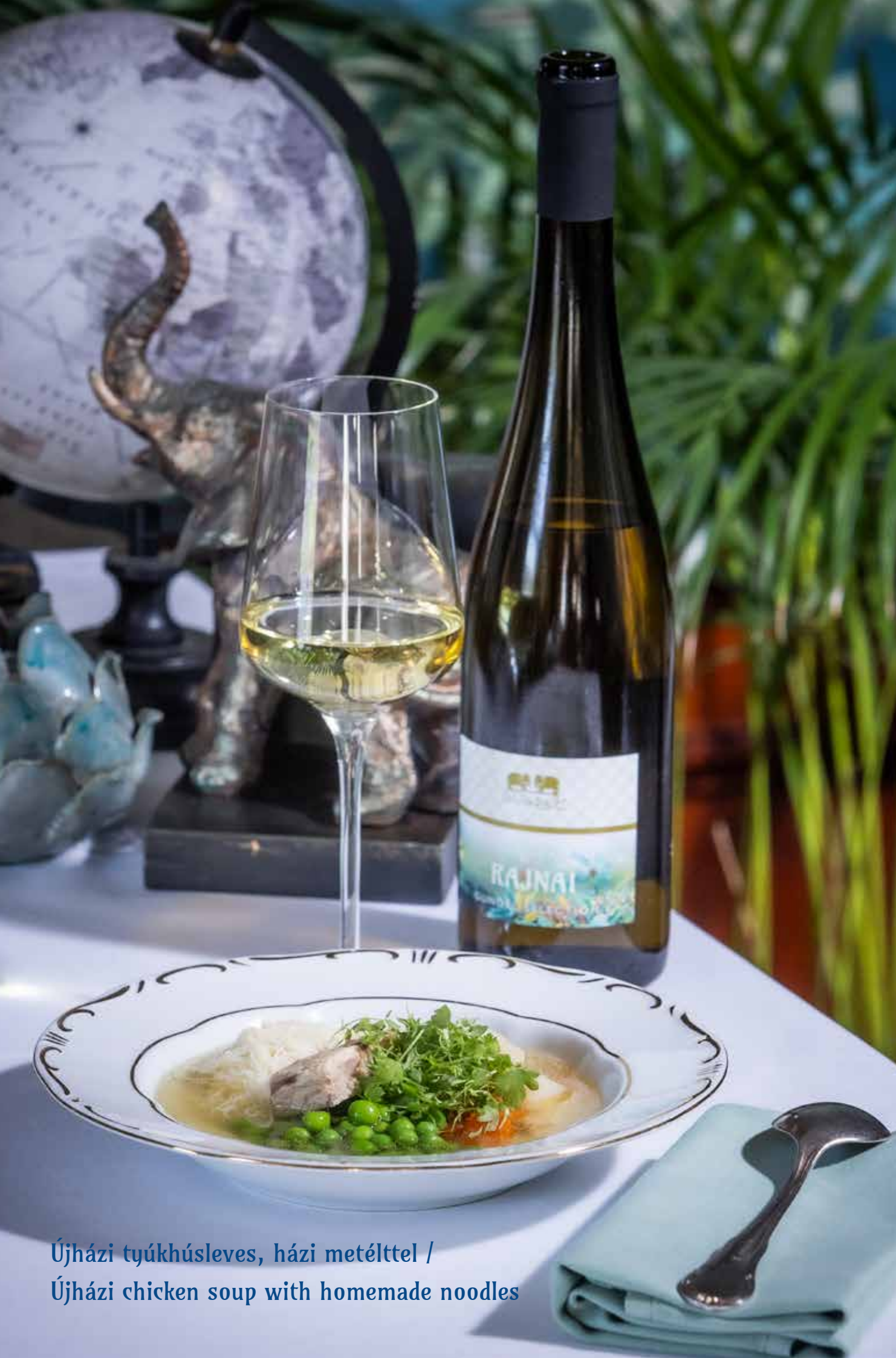
Újházi tyúkhúsleves, házi metélttel / Újházi chicken soup with homemade noodles