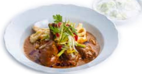
Paprikás - 1936'