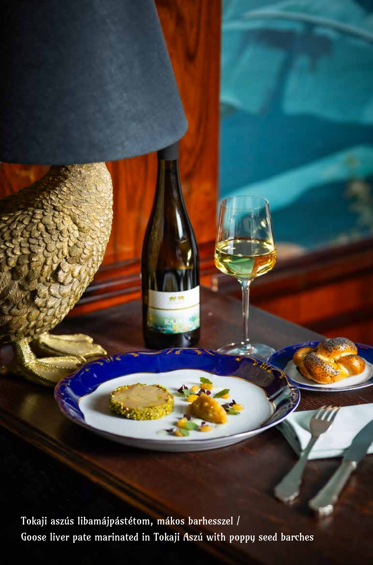
Tokaji aszús libamájpástétom, mákos barhesszel / Goose liver pate marinated in Tokaji Aszú with poppy seed barches