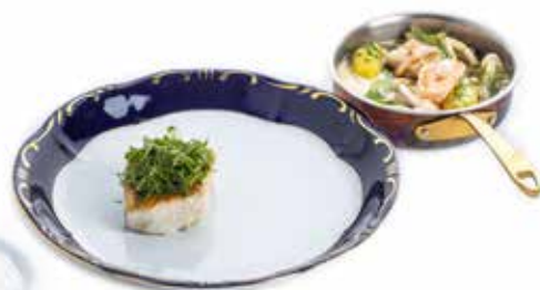
Kárpáti - 1876'