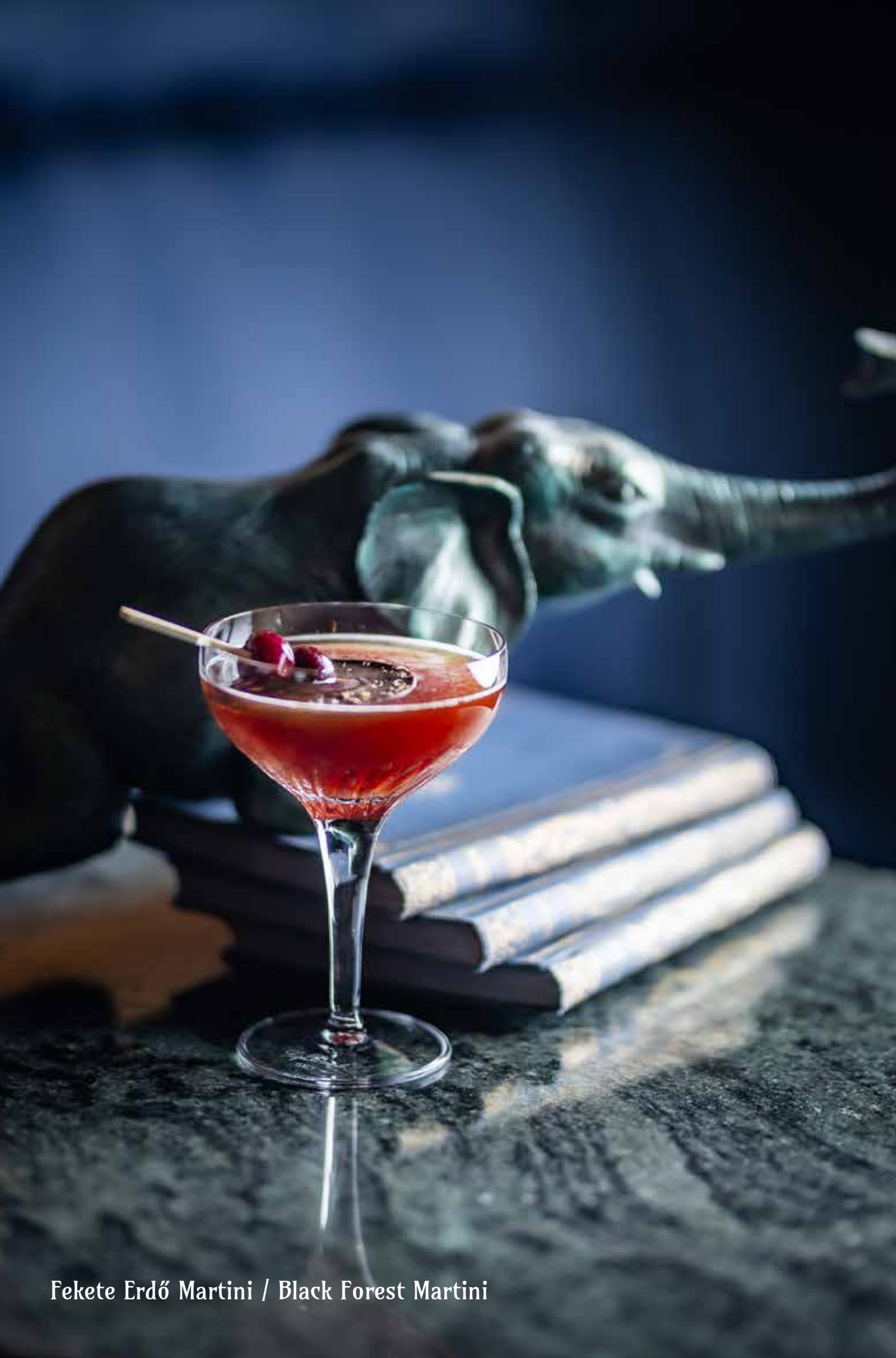
Fekete Erdő Martini / Black Forest Martini