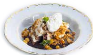
Somlói - 1958'