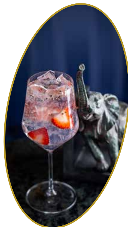
Martin Miller's Gin&Tonic