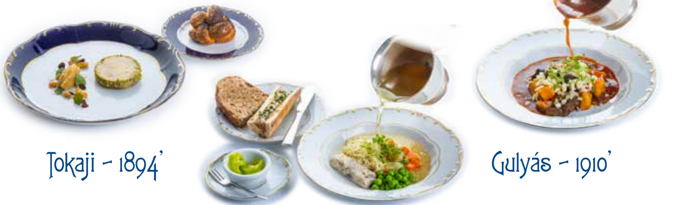
Tokaji - 1894'

A Gundel Nemzeti 11 válogatásának fogásait ez a jelzés mutatja.