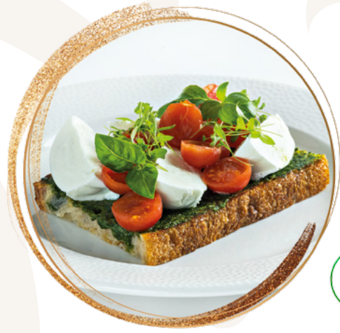
Buffalo mozzarella with marinated tomato and basil pesto

Allergic marking / Allergénjelölés: 7, 10