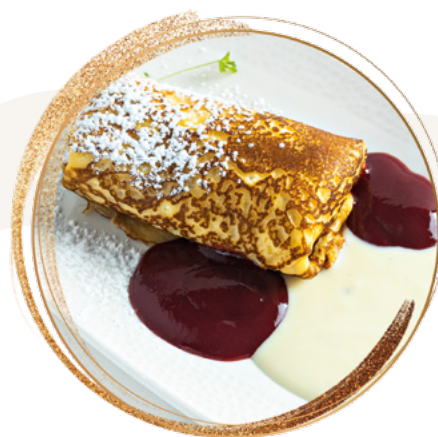
Pancake stuffed with cottage cheese, served with vanilla cream and strawberry coulis Túróval töltött palacsinta vanília krémmel és eper pürével

Allergic marking / Allergénjelölés: 1, 3, 5, 7, 8