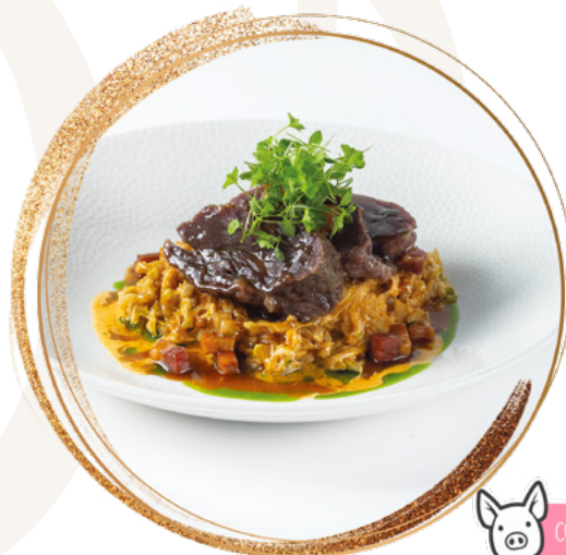
Beef cheek with Hungarian sour cabbage stew served with pearl barley

Marha pofa székelykáposztával és gerslivel