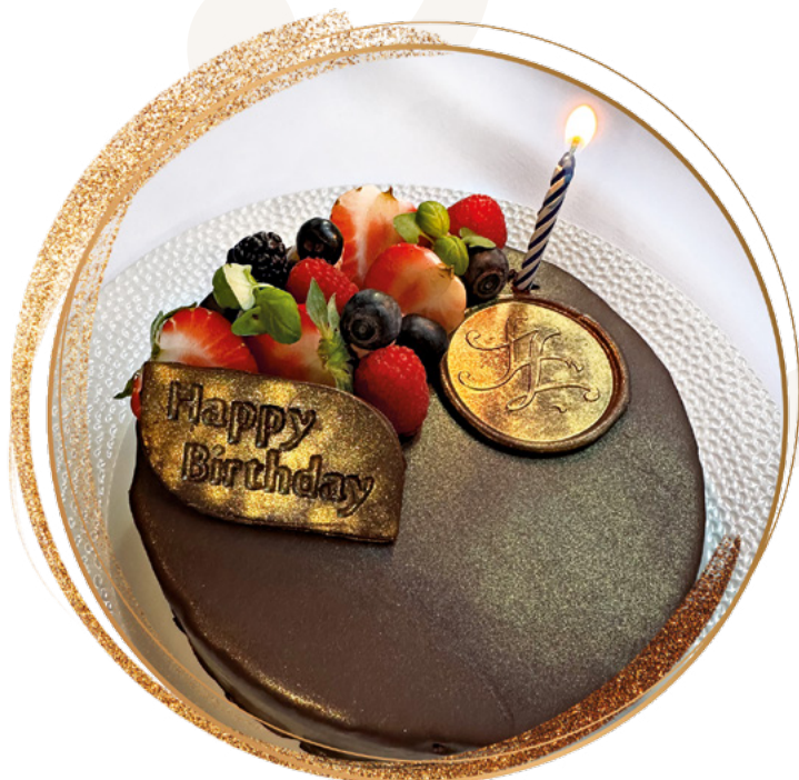
New York birthday cake 8 slices

Allergic marking / Allergénjelölés: 1, 3, 5, 7, 8