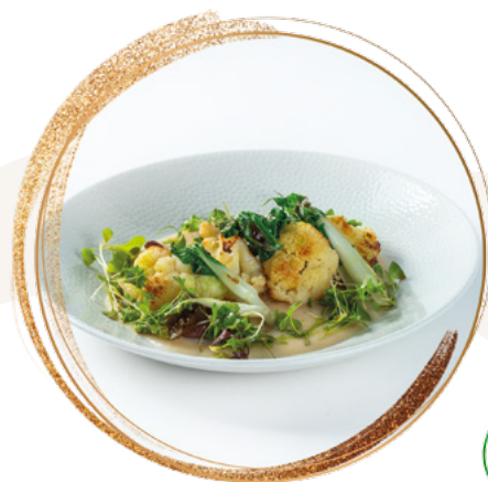
Baked cauliflower with white bean puree and shiitake mushroom

Allergic marking / Allergénjelölés: 1, 3, 7