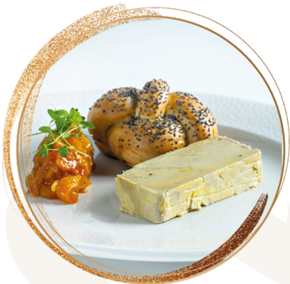
Duck liver terrine with apricot chutney