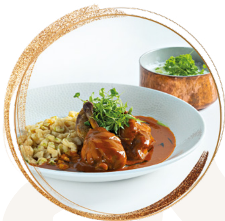
Chicken „paprikas” with spatzle noodle and cucumber salad with sour cream

Paprikás csirke, házi galuskával és tejfölös uborka salátával