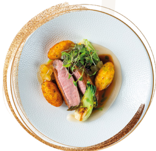
Roasted pink duck with pear and „Dödölle” dumplings

Rózsaszín kacsamell körtével és dödöllével