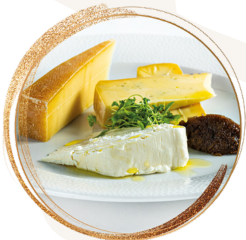
Hungarian cheese plate with fig chutney

Allergic marking / Allergénjelölés: 1, 3, 7,