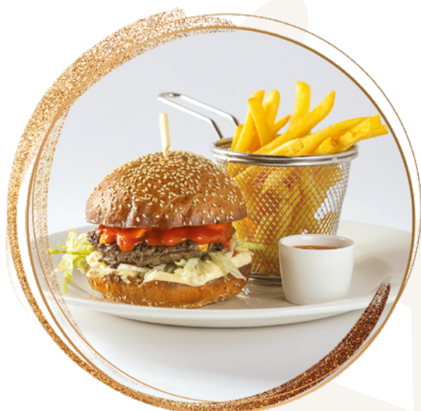
New York Burger New York Burger